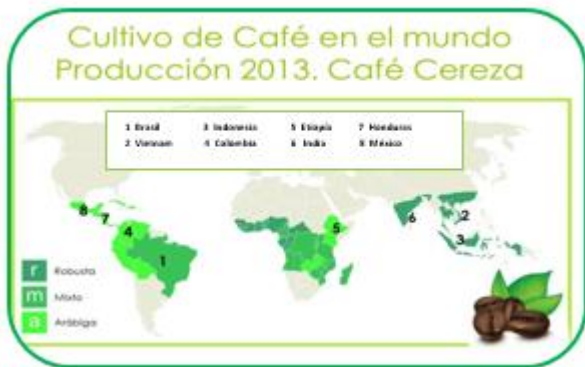
Figura 1 Mapa de producción mundial de café, por tipo de cultivo y región geográfica. 2013. Elaborado con base en Jaime Arcila Pulgarín, Productividad potencial del café Estado actual y perspectivas. Investigador-Cenicafé-Colombia y datos de International Coffee Organization (ICO) 2013.

México ocupa el octavo lugar como productor de café cereza a nivel mundial después de Brasil, Vietnam, Indonesia, Colombia, Etiopia, India y Honduras.