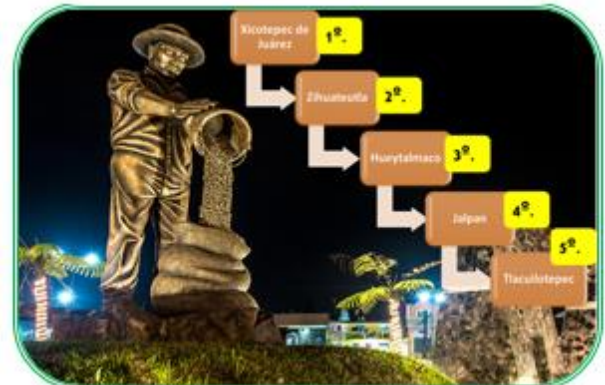
Figura 2 Principales municipios productores de café en el Estado de Puebla. 2013. Elaborado con Datos de AMECAFÉ 2014.

Su producción promedio anual fue de 246 000 toneladas (tons.) de café cereza entre 2002 y 2013, con una superficie sembrada de 72 174 hectáreas (has.) de las cuales se cosecharon un total de 54 205 has.