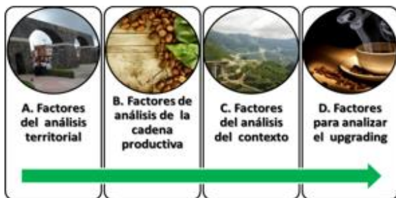
Figura 4 Metodología para analizar casos de Desarrollo Económico Local, de FERNÁNDEZ-STARK, K. & GEREFFI, G. (2011).

El marco analítico de las cadenas productivas permite entender cómo empresas, trabajadores y consumidores están interconectados en una misma industria ya sea a nivel local o global; así también permite identificar el nivel de desarrollo de un territorio o país en un determinado sector productivo, y exponer cuáles son sus posibilidades de escalamiento industrial también conocido como upgrading (Gereffi y Fernández-Stark, 2011).